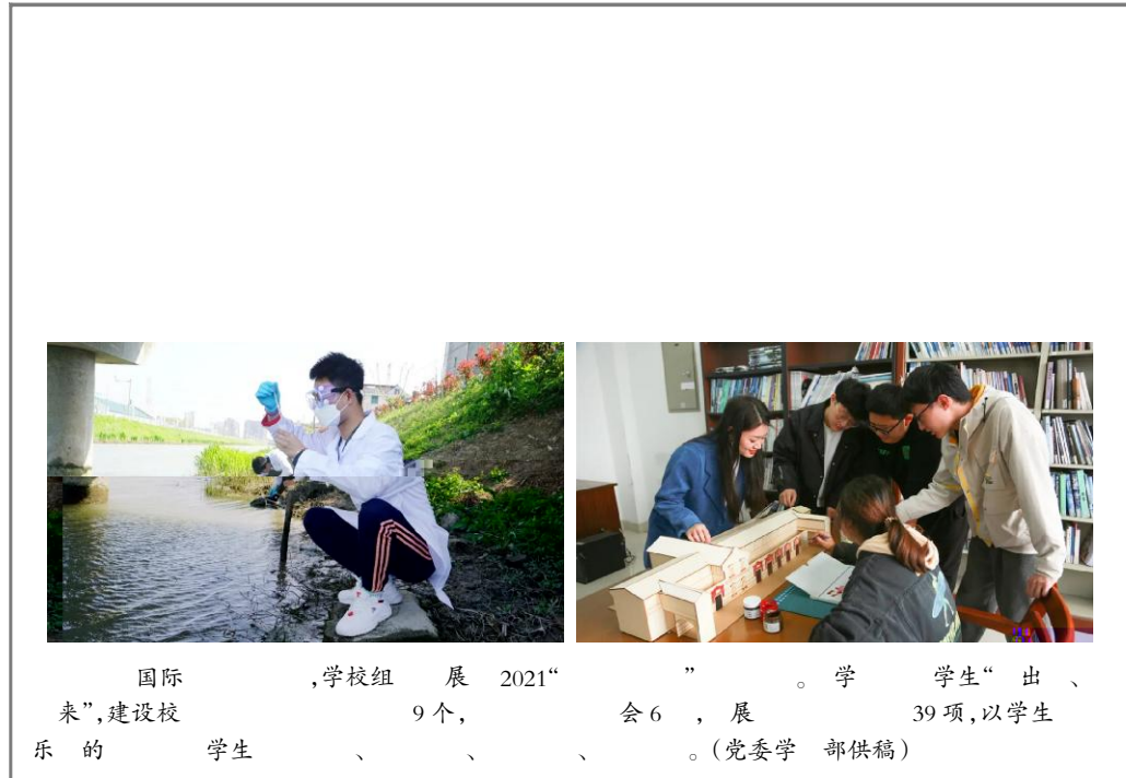
国际 ,学校组 展 2021“ ” 。学 学生“出 、 来”,建设校 9个, 会6 ,展 39项,以学生 乐的 学生 、 、 、 。(党委学 部供稿)

y走活M是 y 文4 的一项活M,“K党 y9征”b主 i。活M期 主方推 100 党 % ,希望广 教职工 从党 % 中 奋进的 9 ,从 ? 走中 y ,~ 的精神 建党百W。 (校 会供稿)