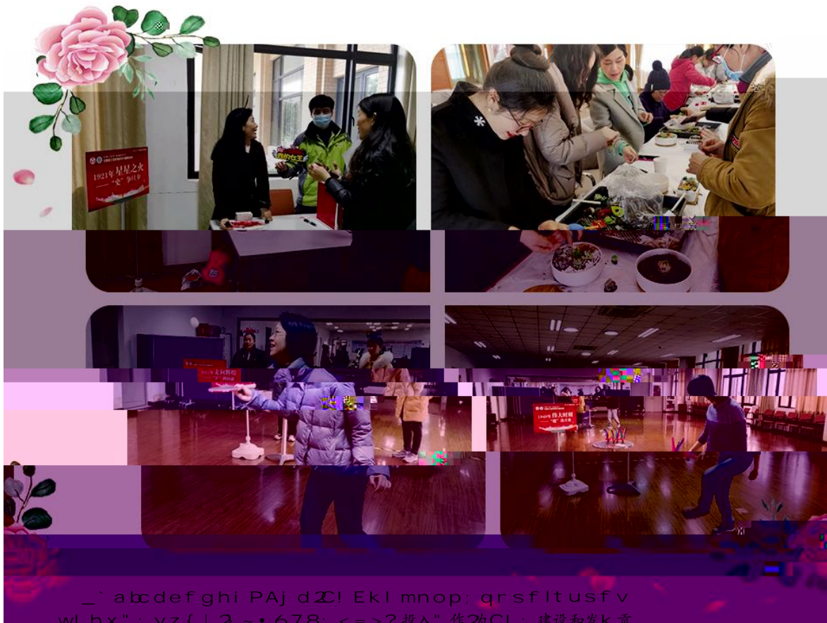
图1-6展示了活动现场的各个环节，包括嘉宾发言、互动交流、启动仪式等，现场气氛热烈，参与度高。

市科委、市经信委、市市场监管局等部门联合印发《上海市促进食品工业高质量发展的实施意见》，明确到2025年，全市食品工业总产值达到1.5万亿元，增加值达到4000亿元，增加值占GDP比重达到1.5%左右。