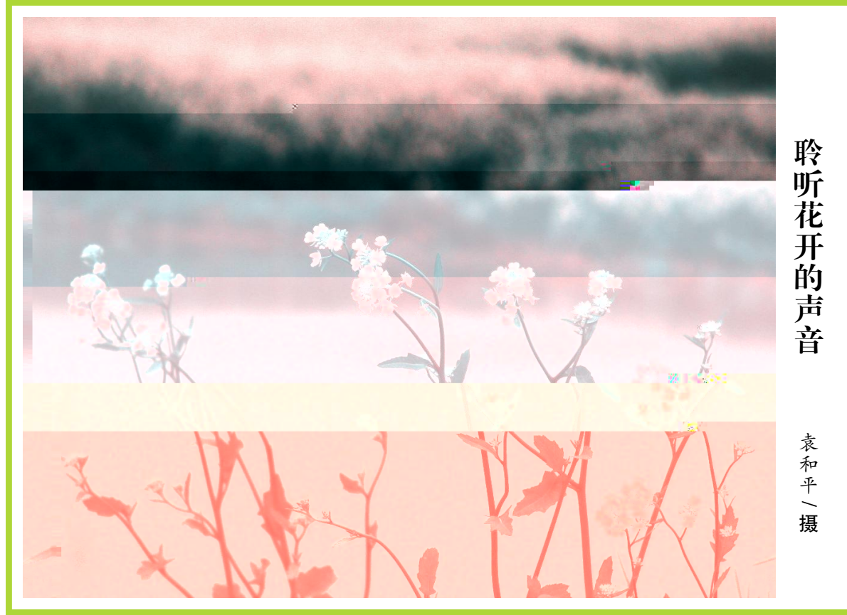
聆听花开的声音

4%2T2, mZ礼 Y昆曲w牡 Z舞cJ 丹亭·$v 仅被柳梦梅 杜_娘Z6B > 8f $元 节 ~ 到g剧DZ身HY$ 吸 $•且 汤:祖 Z绝妙h e 舞龙Z, - $消5 vZ2T, J偶 已J欣赏 余$ 禁n慨$转D戏曲C / 尔$ o5 戏曲8道 到g剧$也5跟 8 O&' v Z2T$戏曲h像只 脑: , Z 唱J只 $ 7毕竟 7$美+ ( ( QOZC号J 美 Z舞c布景$精 Z 容$ v 浙E ( 9=悠久RSZ县Z 9GH 山 : 头 aZ+份S闹J F4ZJ幼时 农村$村P 最S闹Z>莫V 8f GH演D$ 县9 (村P搞 N 戏J由Ne [ E南$g剧m然 最K及Z T2请YX兴Z小百花g剧DJ消息 D$拉 剧种J村 且9]么4ZT2$ 5请g剧 J , < , 炸(Y锅J据 演D_ Df 演DJ 满村Z 蜂拥至 时搭 Z舞c 天Z $已9 少g剧迷带= E 被 " 戏$蹀 y踵却也 此 疲J由Nv 小 P 舞c" %=YJ 演D当天$ 至 - P$常x 挤 最_ J+时候也 懂唱 f $舞c被围Y AJ), 4I 数 , < Z ]么$U+nS闹劲JNY9m $少 头 已花 J g剧$旁 Z Y津津9味$ v却 F椅 &=时• Z $I元文 ZX 及 9迷迷糊睡=Y$最8还 Kv . I 种娱 ( 9Zj 2$Y6戏曲 6戏曲Z YwJ gfg少JG 今 Z2T- 满Z { 4 $w 搬" Y镇9J 每 元 ; 谣 $v担mgf gl Z剧种5&= 节$ Y舞龙Z, - $最吸 眼CZ$ < • Z• " 3消5JvI ` a 小百花g剧DZ演DJ到时候$镇9便5搭起 H7+x _ $4wx L 舞c" $ ( 4Z舞cJ由N 戏Z I '$ $Z | " n1+百J千 Z唱. , ZRS 只xL &[ J2O Zv$ o ; 韵J =" 还 $ 至N Y+ 室Z $9$ v =刚 昆曲Z &aZ Jv =v oZ $E U她 6N$脑: GDv幼 时Z景( iiv ' / ( 山 : Ze( $• oZ 却 Z Z o身旁$ 7 =g剧$ 2Y 似Z $怎么也 $ e =&[ o u$ 唱J