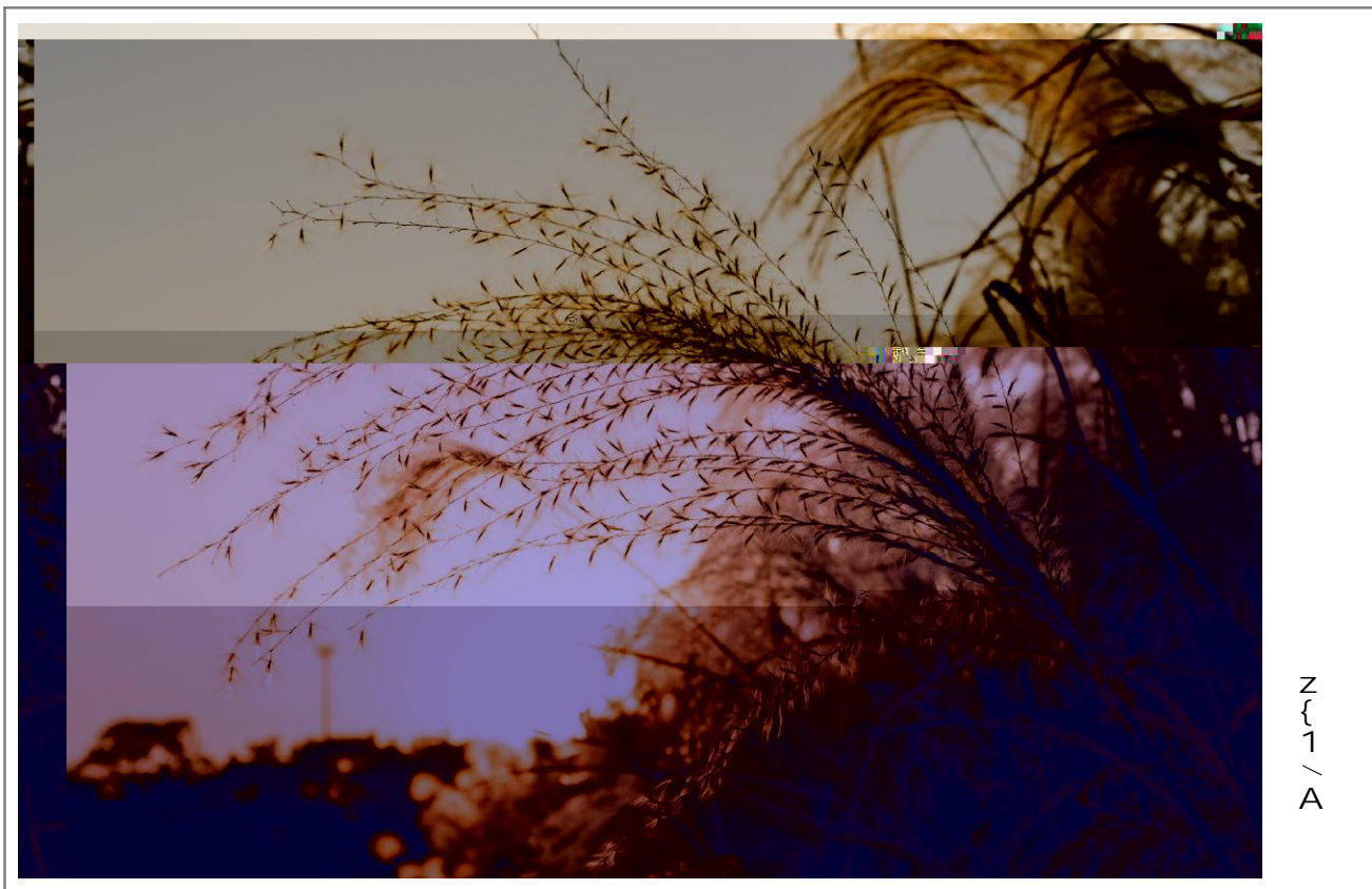
Z { 1 \ A

7 opw . u -LC CLrq 我j hrs t uv 看 -w . u =x wy T aj 字z { =x ! |情gAZ - 作$9 U 生 感悟 /} , -刻在 " 9. " 所 h y " 5- " 我 在@O 候; 实 7 被 我 在 Q深? 也 7 错失 究竟 +我 R 起 遗 憾 O 某 遗失 美} 作$S言 分 r 我 R 我d刻 r 7 . u -- 9摩 u-共aLv o述 男 z} 穿M , P 用 Ee, PO P过} - < ; 实 u- 始 吸@我 - . l 奏 W 电 / 我看 u 分 一 便z @沉 浸R WI 奏 u 我 情 - - , 平Z --4味 u r 我 { | F 澜壮阔 大 & { $ . u + . M! C 约 俗成 大 & 它M 在o述生 VB 男b z 婚 >倾盆大_ . 被 - . j : aw 婚礼蛋糕也 为 9 缘< 被弄| -1 糟 实在Y 上 一 愉> 婚礼 婚礼 男 z" b z 你觉| 我 婚礼| -LM朗 f} - ? b z 我觉| 完美 自D深u w 婚 M -[ 分完美 情 u 男 z b z u情! 电 | C b 祸 失Q =病 T 烂 俗 * N' 治愈w 9N, 够; 相? 感t aLw 浓浓 u M 生 吗?我 自D所u w { 许 少 我u你 v 我 始终 7 我 USy深u> 方 D u情 u " 情 fh r 我 男 z穿M , P 自 族 遗 2 父" f } L, P 男 z; 父 " 葬礼穿M4-Lo C 父 " O在\ 5在书h 沙 上 阅 狄f X v 父" 看 CL眉 自D ! 分相! 男w? 在书hZS 表情凝重 便z . !分 CL U 自未 男 z 过 父" 一起穿M 4 味 所 >< - U 父" ma BC 过} , P+|> < | — — > 候 R 穿M4 晨; 2 - v 我 在生 遗漏 C v美} ; 实 L I 也W用R 穿M 我 G- @O | 令w沮丧 /仔_4想 6, - @ v MUp -LO| 大M 看e 洒在 上 -u y&& 看 上 e 剪成-u-u b 则 F案 听 名 鸟a在枝u欢> 鸣叫享t Y Dv" j | ·)) O7 生 \我 vL福吗? u 男 z R 用自D , P 为 过} 一 享t - M 生 K 尾Y 上完美 /我' <在;