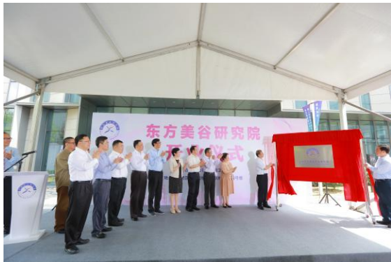
一、聚焦学科专业建 !主动" # $ % & ' ( )

国际 S ss落 & 6书 L 在期 许上海 tuv w T $ 6 P实B x 上海 ; 重大任J ) e 作为 Ly 用技术 名 方科O 上海 用技术大 d 8T; z-(q e 上海 KL 大MN 建设 r `上海 美丽- { i业 PO| 上海 : 上海Zq MN建设 } 用为- > " 做在 大上 焦O•平 科业建设 焦用型wx培z 焦技术t: t) pq 积极&A区m@D !k" O 6 作为 用实实在在 ? 成效# $ > 方O V O质量 满