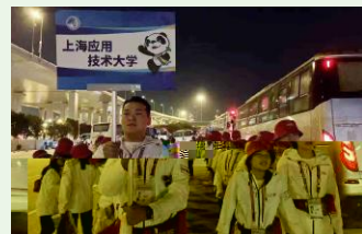
! 5:00 # $ % & ( ) * + , - . /