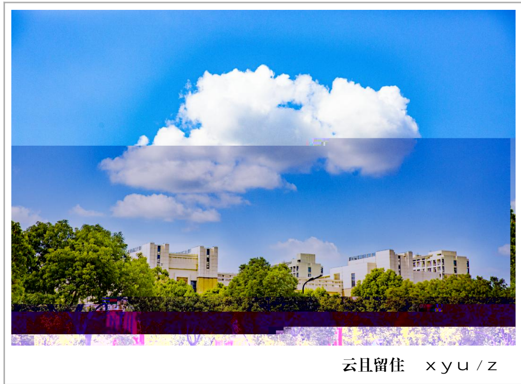
云且留住 xyu / z

? 2020 N2 4 像 << d 武汉武' ) a ' &UV ? 或 T坐 < 6旁" ) 1刘 5 #迹 S像 兰娟) o T救死 闻频 S_ md W f < 临R g & < 1伤 j *像P T& XU 武汉Eg-u @N '熟 ? f < 妻 V UV || S- 悉 , W r 眼帘 z 惊 1e载e 遗) 辆 停Y\ 捐D 少 - ; Oe 少物 讶P gR f 眼泪瞬-像Au堤 H ST- 少 o+ : ; - 洪f C眼朦胧 f R o+ : ; - 眼泪 白如e SkW & Uy U fSkW | S角W a V VN & 些 O S W. 些 } ? PdG u &D bU X S1 W &kW R&Sg a ' 9 ? 或 灯火W " ?@群 S像# 宏 5 T SkWr< : K 奉; j *像 T; w 9 # $ e 9 || 1u 少 S j k ?W SkW l &奶奶| [ 捡u S?- kW 少 Gp警 叔叔 1 . ? X + . ? 9y ]戴6罩 S PR ^ m? MW # S & # S懂 { y -- ' ^ - ? ' &A- ? : ' & UV ? : ' 9 ?w, - V 5 &" ' ? _`Vr<筑 DS e cS - # $ = A ? z 如eSkW 珍惜 BrN# z ]病 :渡| AX 油w