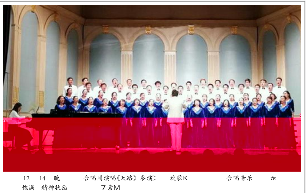
12 14 晚 合唱团演唱《天路》参演 欢歌K 合唱音乐 示 饱满 精神状& 7素M

礼 /- . 数 1a践 作站站 邱翔介绍了a 践 作站的师资及Tw情况 对 作站课 题进 了详细分析 希望 生 作站 习 发挥 Nu 性 选择课题进 团 负责人 过讲座 讲述了创新的 要性 生们随后 新芽志愿者 带领下参N了 - . 技术 史 - . 技术 /- . 数 1a践 作站!" # 少 需求 认$ 特点和创新a 践x 育规% 以 "a 践 作站"为载体 & ' . 高 E 等cQ资( . 内) * + 别 培育 生创新 精, - 展 生创新思维 . a 生创新$ 识 t 化 生创新