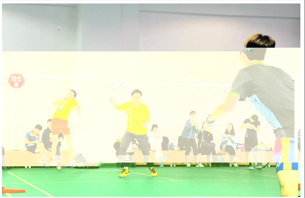
4- 8. /2017Q 232456 789: ; <=>?@ABCD= EFGHI /J KD=LM$ NOPQR9: STPQU 122VSWXYZ[ \V] ^_` aBbcdef ghij kl m>nopL qr EFst luvEFstwxryEUz{ R| } ~• a

, tk% 10名_ mt d o$stu [! %B程ou中 \ 上 L Bo中 U师U_能力$ 海市 vwr s.第x' { /院% O立 B程ou中 rk; 技 技能 y数z A{ By前 能 oi d` a机c$ j! o$中 |[ L} ~d%名B %; B程ou"y: " 程师\任 oUu$t名 U 基; K O%&' O" LO%( ) 师\任 C任• UK * + # $&