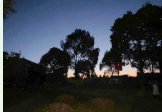
详细报道见2版