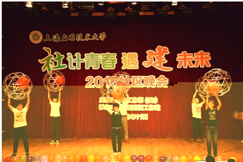
灯社团奉献了《红山果》表演。(二月廿日晚, 我校@5社区晚会举行。图为校社区滚

言# 校今年参加海外学... 学 代表 享了 己在... 8境: 外期 学 U。... 次 化节 海外... 享会、学 海外 留学... 摄影、 外学 趣味乒乓... =、 外优秀影v赏析、 外学... 跨 化 vn会、 化教... 育 讲v、学 海外... 巡礼 外 迎新联谊会 个... 成。 外 明在{ 入沟通... d ^碰撞B创造出巨大 包容... 理~ , 为校园奉上独特... 化盛宴。