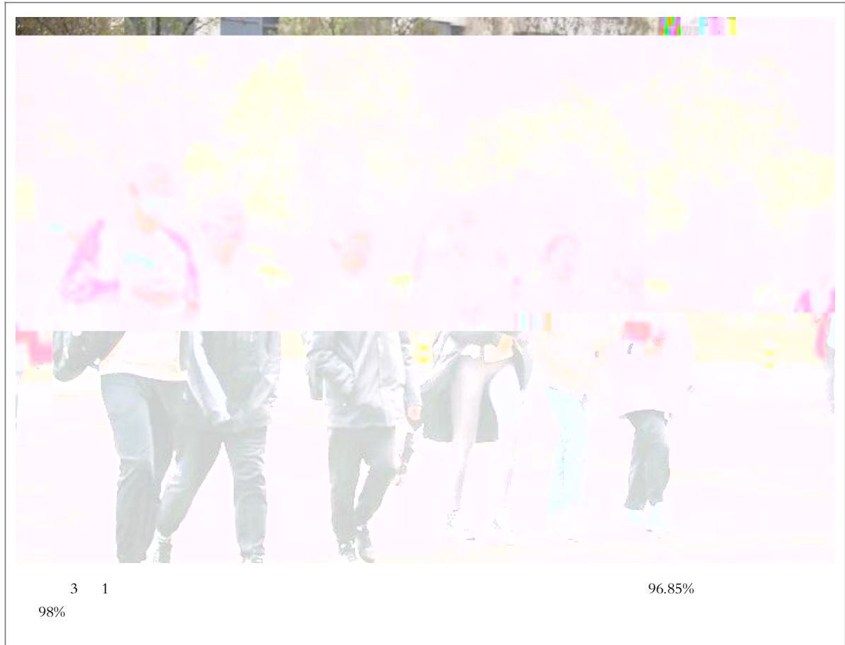
3 1 98% 96.85%

# 1 征 " M 优异 绩 迎 接 , 100 = > j pqr 带 n , w J 志 # \ \ = > ? CD _ 央 , [ # \ ] ^ 9w n N @ Q 市 , [ # \ ] ^ 9w n " wG 继续巩固 ) 忘 * I y D 使命 to W ^ Q L [ 1 # \ ] ^ a 得 N 效 经验 " 确保 # $ PQa 得 + j n " 经济 管 # 院 , BCDa 真 I 城市 安 I m # 院第 4 , 支 v CD 郑 楚 婕 分 别 M YM L [ 1 # \ ] ^ 激 # 院 守 正 Ad f M # 促 p " MR ^ 人 " T L [ 1 # \ , 眼 , 耳 , 脑 , * f XWV 交流 言 $ , BVBI k $ R W Y " $ B V B L A V R [ \ ] BI ] Y L Y R p c K M S G V 支 I , [ # \ ] ^ N 5 " 提 Cuv 认 z QD G j