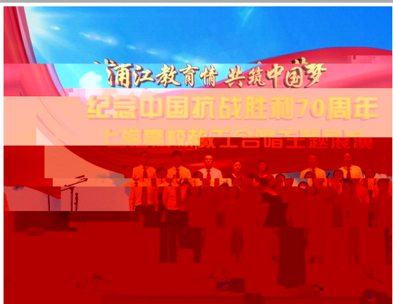
我校教工合唱团参加了上海市教育工会举办的上海高校纪念抗战胜利七十周年教工合唱交流展演

017(通讯员 饶婷)6 1 上海应p技2 p 悦 >' 牵 S @圆S ]赠 ( 在贵州R黔 南州天t 县垒r 小 ( 上 垒r 小 师 感 悦牵 志h者们的 爱心与付 得 天t 县Z 台 黔 南Z 台 c家媒体的 者跟踪 道 悦牵 益l m5为 圆S u 为 " 的线上和线 宣 名 _ $ 150 余 GH筛D 120名志h者与垒r 小 120名小朋 友 u@ @ 120名志h者 i 的* i 小朋友们实: @儿童< S想 悦牵 益l m5 r l ^ N 100余件体j 器V赠 垒r 小 | ^ ^ W<= $ 13000 F ^ W _ $ 230 件 悦牵 益l m5 2014 与垒r 小 + i 每 儿童< * 会 u 圆S 至c %成功 150名贫i 儿童圆S 们 " t+ 为v小 P立u_ 籍阅览 悦牵 的志h者们( p 为3 4>的z j 尽绵' &i 同 +) 大 4于 q爱 的精. 发: 大