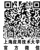
上海应用技术大学 官方微信