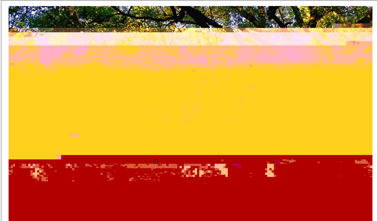
秋意继续

处的#是 %, 的"Z是d~! K 近的 ) ]从 地 Z来的一 A " 2 4了z ] ARe有 的一 2K4了 , "Z是一i 于秋# 的T 的 , ] A在 面4 了一层 的z " 是用极^ 的wp的布•! " # 的$Q" Zy%&R的地方就是$Qm 4' Z来的( ) ]树* R+ ~作镜子" , 头%, - . , 的树/"树/OO地 1落在+面4"+ 开. 地' 了"23Z -4456] z. , 的78/ 落在 地4"不知 是时GR下的9 "3是: 变; 术- K4=的 , " P=" . <<的一. " =是 z ] 秋# 3` a />]: v\ 法? @的 A"也 MA的4子们K 4了/>的 , "Z是 #的B TC#的D T9#的 < 2 不到的"• 的T 的 , ] #X? 不可) 议的秋# "#X? 不可 ) 议的; ]